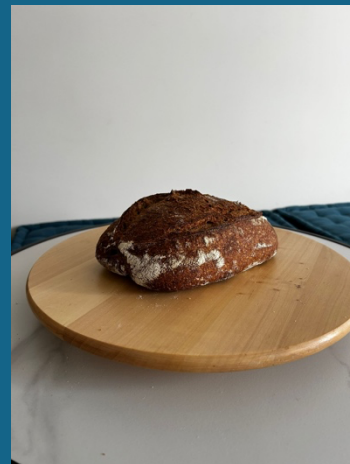
Pão trigo ancianne