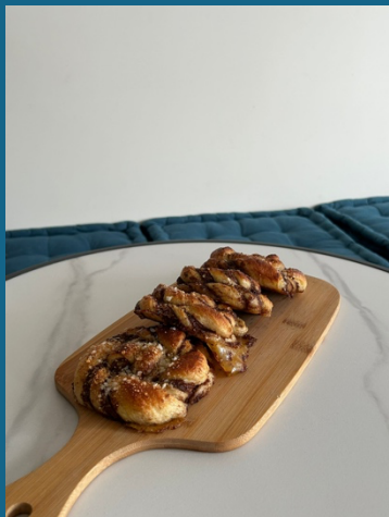
Rolo de canela e amendoim