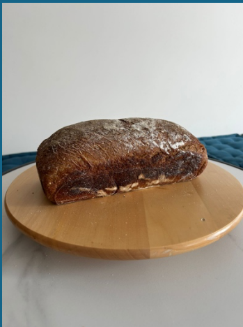
Pão de forma de centeio 1,5kg